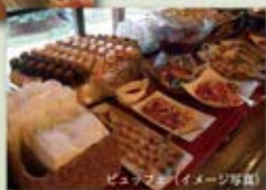
ビュッフェ(イメージ写真)